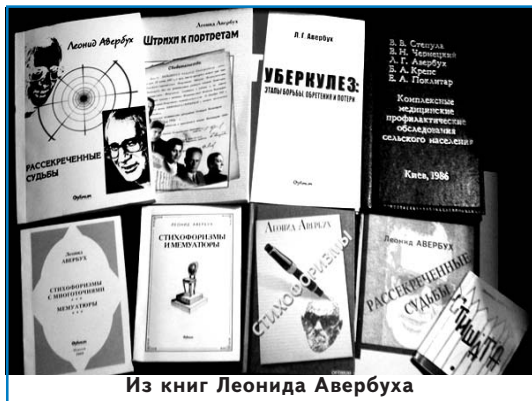
Из книг Леонида Авербуха