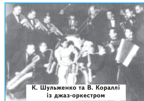
К. Шульженко та В. Кораллі із джаз-оркестром