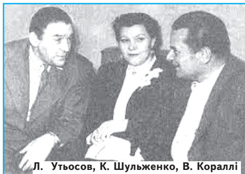
Л. Утьосов, К. Шульженко, В. Кораллі