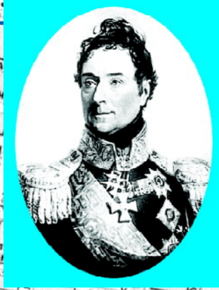
Граф А.Ф. Ланжерон