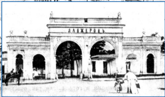
Арка “Ланжерона”. Арх. Франц Боффо. 1831 г.

воспоминаниями пляж. А когда-то пляж был только частью большой дачи генерал-губернатора графа А.Ф. Ланжерона, на которой потом устраивали гулянья, концерты, фейерверки. Но теперь все это осталось лишь на старых литографиях и фотоснимках.