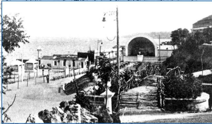
Концертная эстрада на центральной аллее