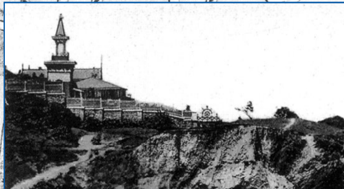
Дача над морем