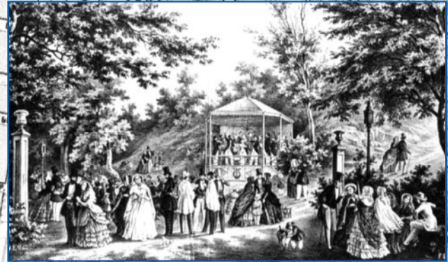
Музыкальный вечер на даче Ланжерона