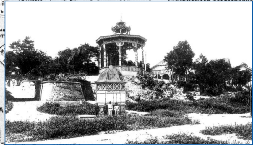
Беседка в парке