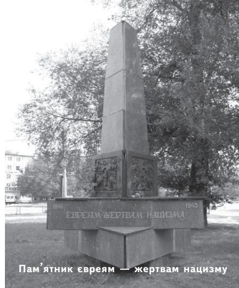
Пам'ятник євреям - жертвам нацизму

працюють програми - кураторська служба, догляд удома, «Банківська картка», «Магазин», «SOS». Як і раніше, Денний центр і Клуб