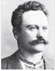
Іван ФРАНКО (1856–1916)

Видатний поет, прозаїк, драматург, літературний критик, публіцист, перекладач, науковець, громадський і політичний діяч. Доктор філософії (1893), доктор габілітований (1895), дійсний член Наукового товариства імені Т. Шевченка (1899), почесний доктор Харківського університету (1906). Член Всеукраїнського Товариства «Просвіта». Народився 1856 року в селі Нагуєвичі Дрогобицького повіту. 1875 року закінчив Дрогобицьку гімназію імені Франца-Йосифа. У 1870–1880-х провадив активну журналістську та публіцистичну діяльність. Знаком визнання помітної ролі Франка в національно-культурному відродженні стало урочисте відзначення 25-літнього (1898) та 40-літнього (1913) ювілеїв його творчої діяльності.