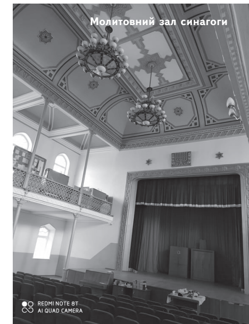
Молитовний зал синагоги

За 30 років необхідність ремонту історичної будівлі виникала досить часто, і практично завжди це ставало проблемою. Причому не стільки фінансовою, скільки організаційною. Життя у великій будівлі